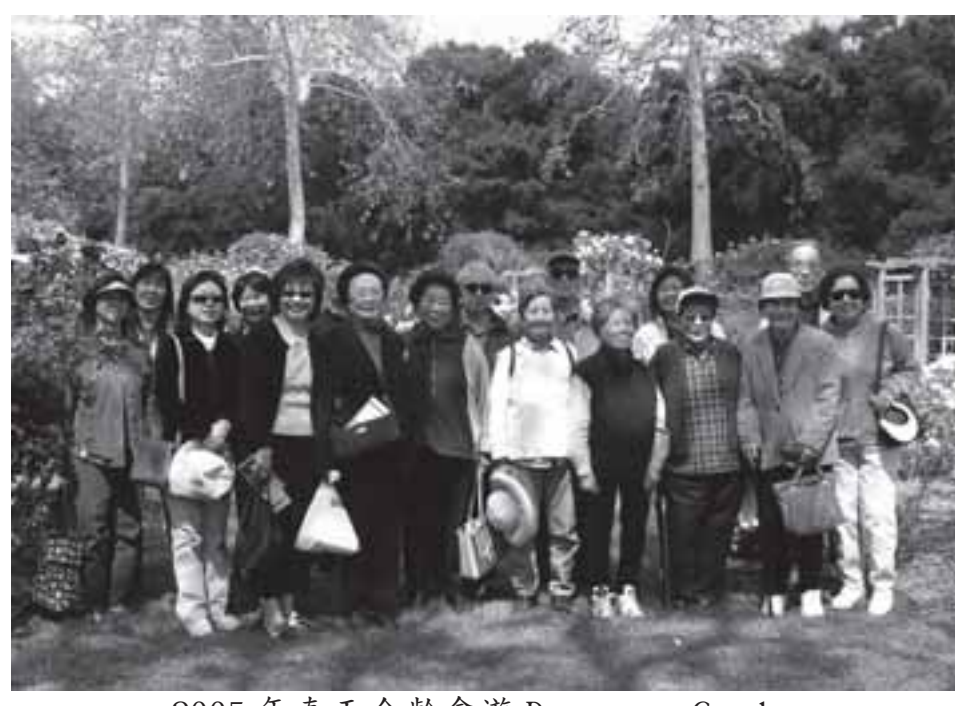
2005 年春天金龄會遊 Descanso Garden